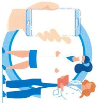
В СЛУЧАЕ ЗАБОЛЕВАНИЯ ОБРАЩАЙТЕСЬ К ВРАЧУ