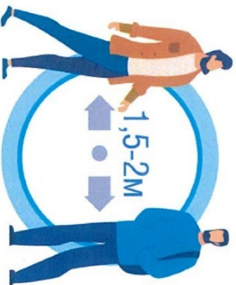
СОБЛЮДАЙТЕ РАССТОЯНИЕ И ЭТИКЕТ